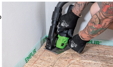
Può essere utilizzato anche come dispositivo portatile (per angoli e pareti).

Qualsiasi responsabilità per l'applicazione o l'esecuzione è esclusa.