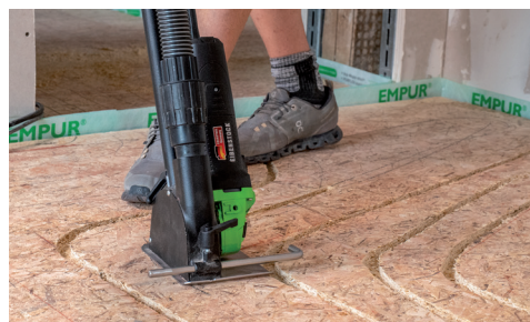
Fresatura agevole di percorsi curvi.