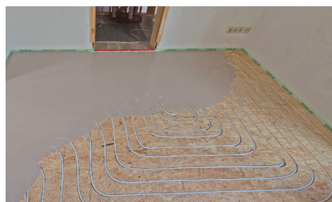
Installazione economica di sistemi di riscaldamento a pavimento con pannelli in cartongesso

Elektrowerkzeuge GmbH Eibenstock Distributore per l'Italia: BVG ITALIA SRL