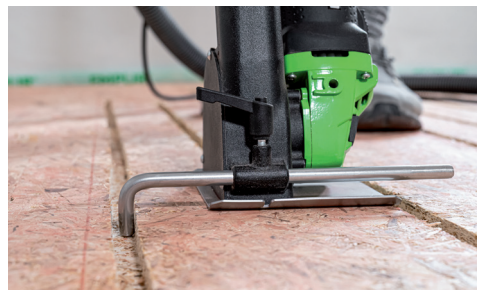
Lavoro preciso utilizzando il fermo parallelo.