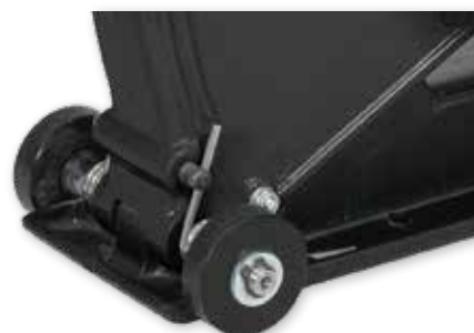
Guida scorrevole grazie ai cuscinetti a rulli

in confezione incl. disco da taglio diamantato Ø 230 mm e utensile di montaggio