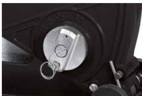
Semplice regolazione della profondità di taglio