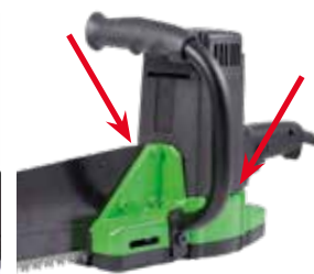
Maniglia montabile su entrambi i lati